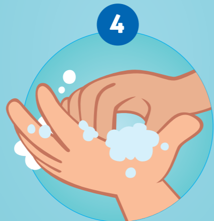
DIE FINGERSPITZEN EINREIBEN, AN AUSSEN- UND INNENSEITE DER HAND ...