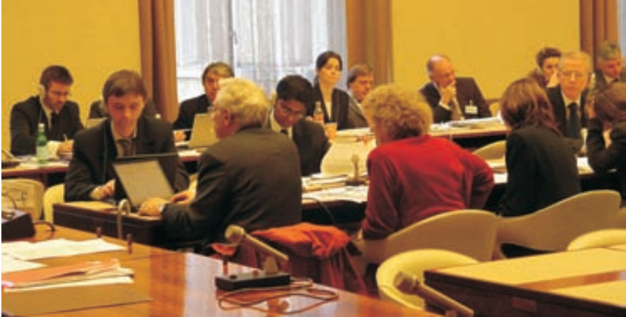
Des experts se réunissent à Genève pour débattre des enjeux liés à la garantie d'un accès à la justice aux termes de la convention.

Les droits environnementaux en vertu de la Convention doivent être respectés par les « autorités publiques », à savoir : les organismes gouvernementaux de tous les secteurs, du niveau local au niveau national (à l'exclusion des organes judiciaires et législatifs); les organismes publics ou privés assumant des fonctions administratives ou fournissant des services publics, comme les fournisseurs de gaz naturel et d'électricité et les services d'élimination des déchets ; et les institutions d'organisations d'intégration économique régionales qui deviennent Parties à la Convention. Les personnes qui exercent leurs droits conformément aux dispositions de la Convention ne seront en aucune façon pénalisées, persécutées ou soumises à des mesures vexatoires par les autorités.