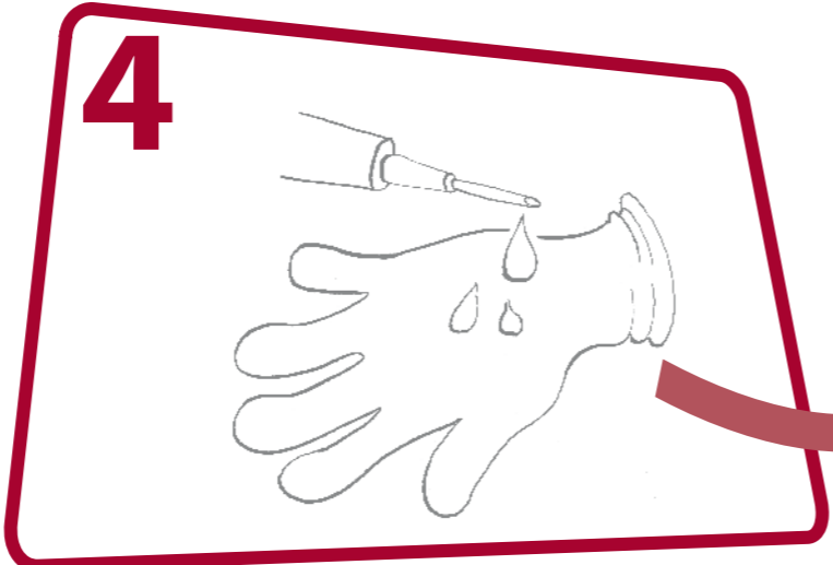
4 Après un acte comportant un risque d'exposition à des liquides biologiques qui normalement s'anticipe par le port de gants En cas d'exposition accidentelle à des liquides biologiques ou des muqueuses, lavage des mains suivi d'une friction à la solution hydro-alcoolique