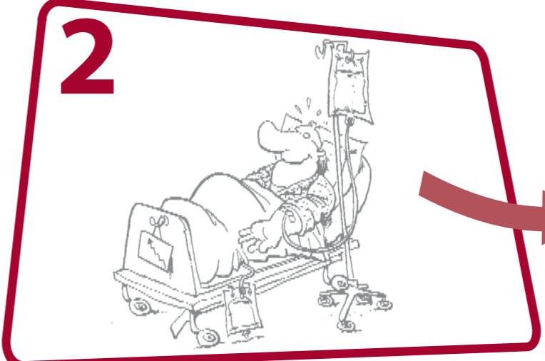
2 En quittant un patient après un ou des contacts directs