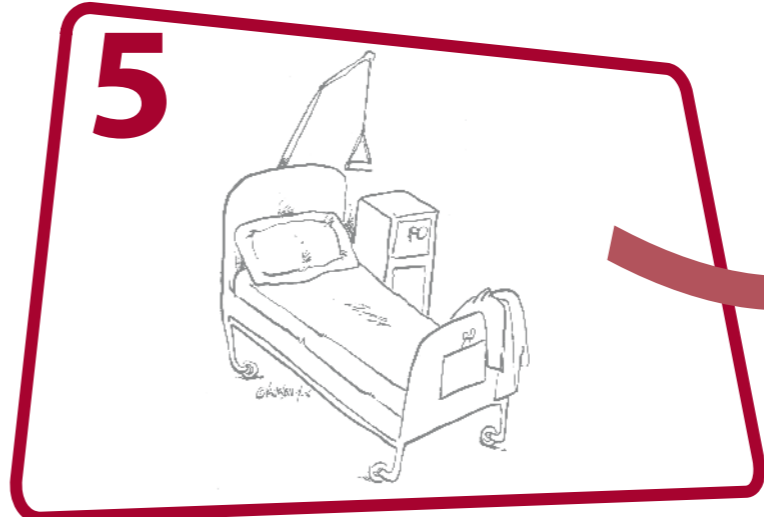
5 Après avoir touché des objets ou des surfaces à proximité immédiate du patient L'environnement peut avoir été contaminé par le patient ou lors d'un soin précédent

Port de gants si risque d'exposition à des liquides biologiques ou des muqueuses