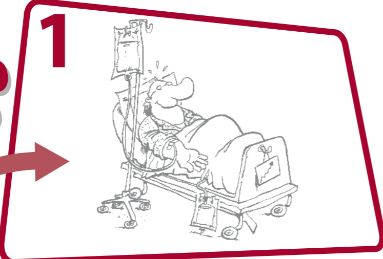
1 Avant tout contact direct avec un patient