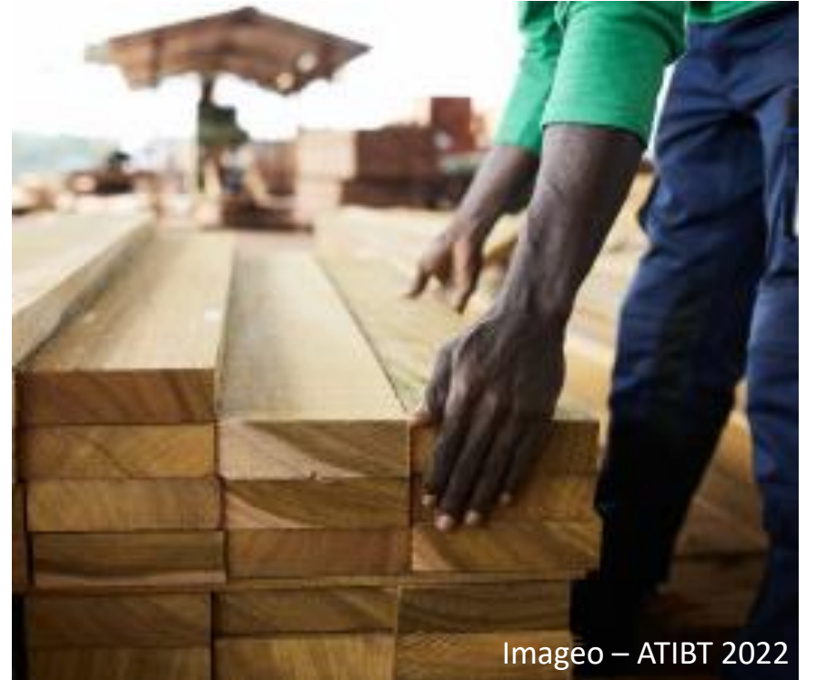
Imageo – ATIBT 2022