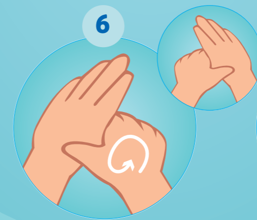
6 LE POUCE DE LA MAIN GAUCHE PAR ROTATION DANS LA PAUME DROITE FERMÉE ET INVERSÉMENT