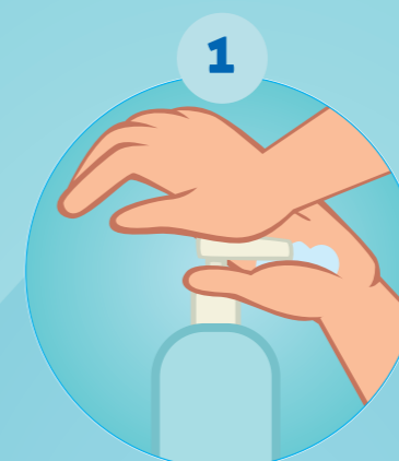
1 PRENDRE UNE QUANTITÉ SUFFISANTE DE SOLUTION HYDRO-ALCOOLIQUE