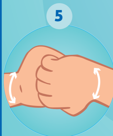
5 LE DOS DES DOIGTS EN LES TENANT DANS LA PAUME DE LA MAIN OPPOSÉE AVEC UN MOUVEMENT D'ALLER RETOUR LATÉRAL