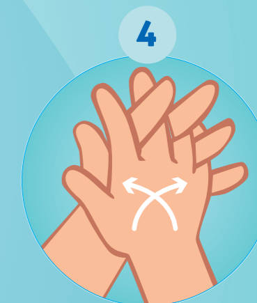
4 PAUME CONTRE PAUME AVEC LES DOIGTS ENTRELACÉS