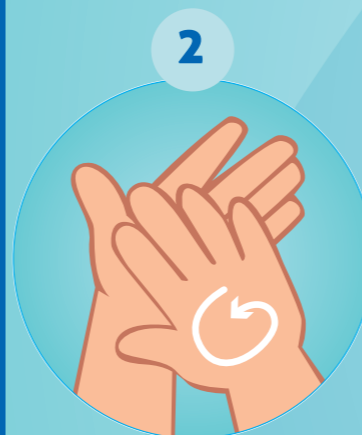
2 PAUME CONTRE PAUME