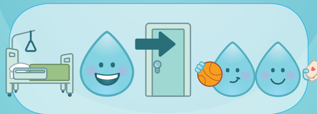
POUR PARTICIPER À DES ACTIVITÉS COMMUNES

LES PARTENAIRES DE LA CAMPAGNE "VOUS ÊTES EN DE BONNES MAINS"