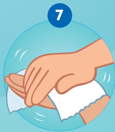
7 SE SÉCHER SOIGNEUSEMENT