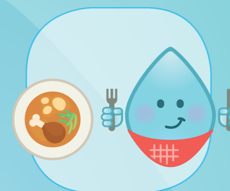
AVANT ET APRÈS AVOIR MANGÉ