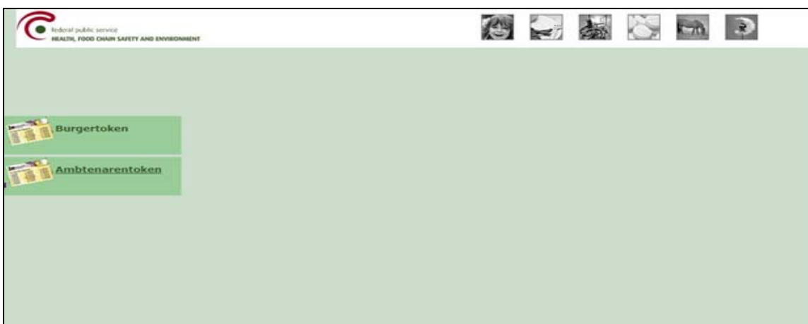
Scherm 2: Burgertoken