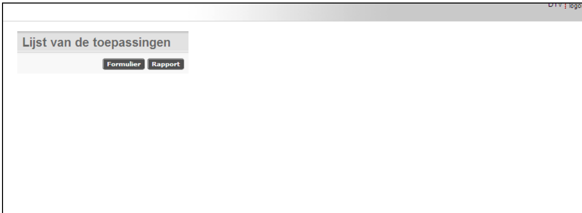
Scherf 9: Hoofdscherf applicatie