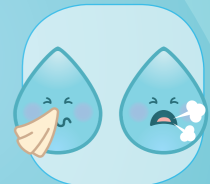
NA HET SNUITEN VAN DE NEUS, HOESTEN OF NIEZEN