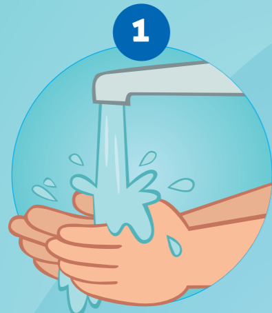
1 DE HANDEN BEVOCHTIGEN