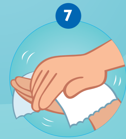
7 DE HANDEN ZORGVULDIG DROGEN