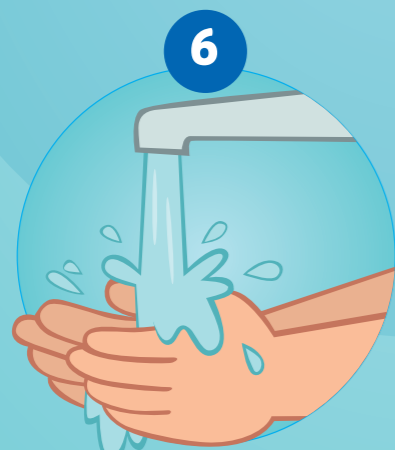
6 DE HANDEN AFSPOELEN