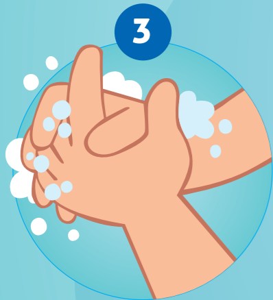
3 DE HANDEN INZEPEN