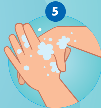
5 ... EN MET DRAAIENDE BEWEGING DE LINKER DUIM IN DE RECHTER HANDPALM WRIJVEN EN OMGEKEERD