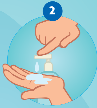
2 ZEEP NEMEN