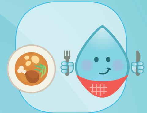
VOR UND NACH DEM ESSEN