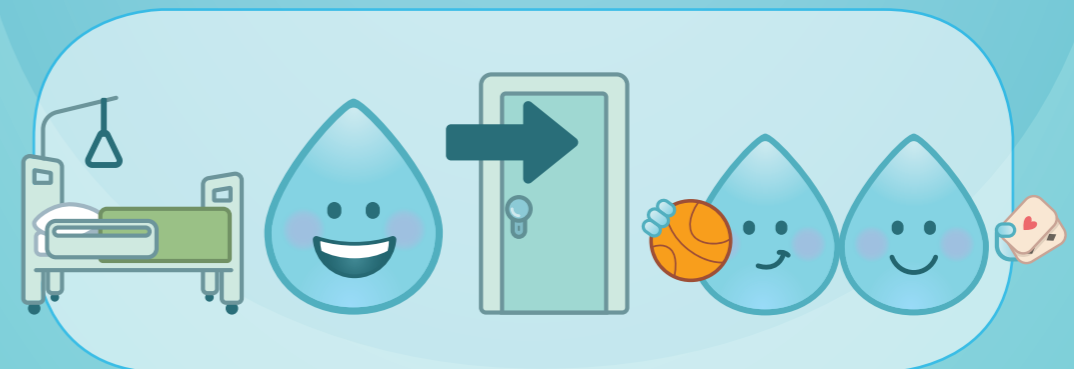
WENN SIE AN GEMEINSCHAFTSAKTIVITÄTEN TEILNEHMEN

DIE PARTNER DER KAMPAGNE "SIE SIND IN GUTEN HÄNDEN"