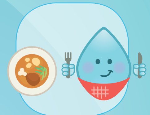
VOR UND NACH DEM ESSEN