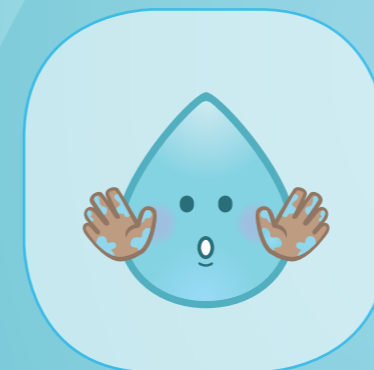
WENN DIE HÄNDE VERSCHMUTZT SIND