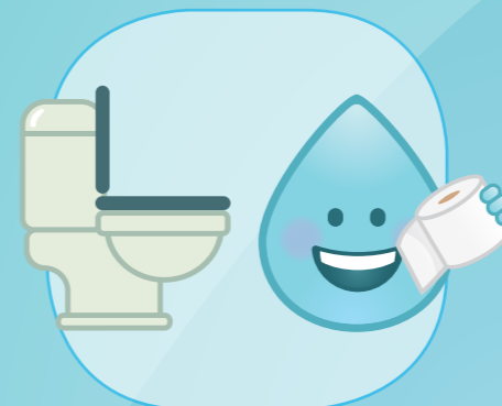
NACH DEM TOILETTENGANG