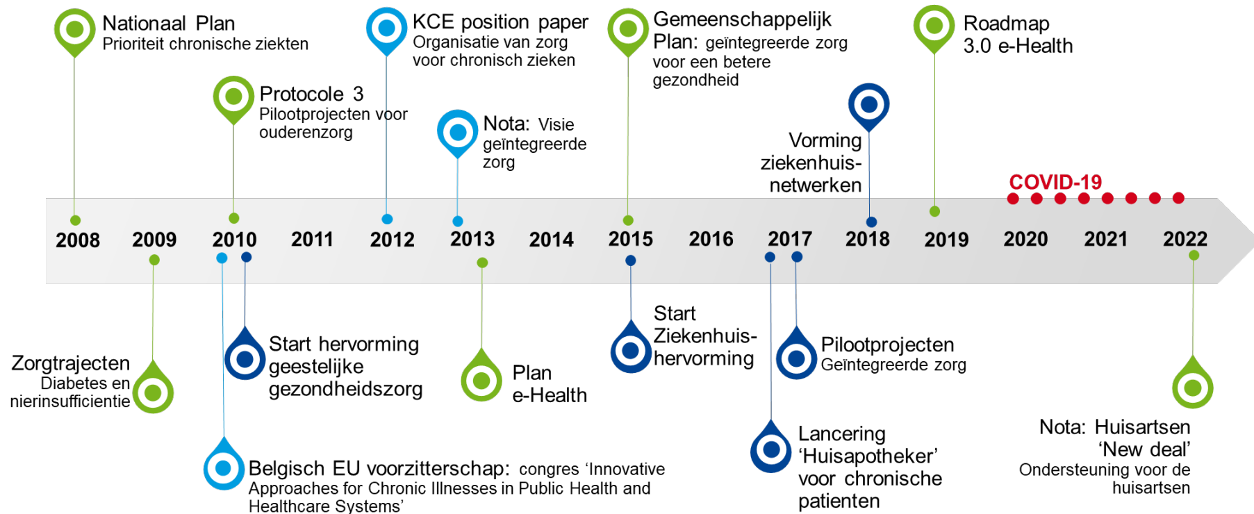
Figuur 1 – Tijdslijn: de ontwikkeling van geïntegreerde zorg op federaal niveau in België

Figuur 1 geeft een overzicht van de belangrijkste stappen in de ontwikkeling van geïntegreerde zorg op Belgisch federaal niveau. De initiatieven die op het niveau van de gefedereerde entiteiten zijn genomen, worden in hoofdstuk 2 van het wetenschappelijk rapport in detail besproken.