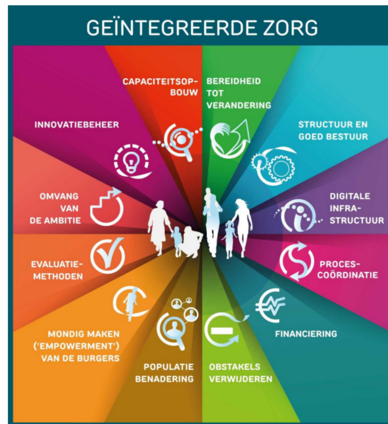
Figuur 2 – De 12 dimensies van het SCIROCCO-instrument