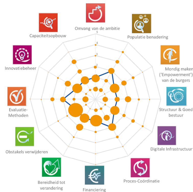
Figuur 3 – Beoordeling van de maturiteit van geïntegreerde zorg in België volgens de 12 dimensies van het SCIROCCO-instrument

De blauwe lijn toont de mediane score per dimensie, geplaatst op een schaal van 0 tot 5, waarbij een hogere score, een grotere maturiteit en voorbereiding van verandering betekent. De grootte van de oranje stippen is proportioneel aan het aantal antwoorden.