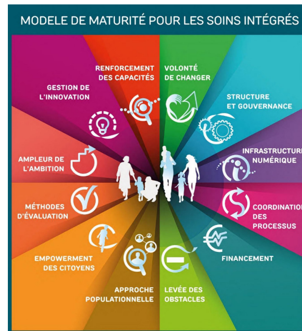
Figure 2 – Les 12 dimensions de l'outil SCIROCCO