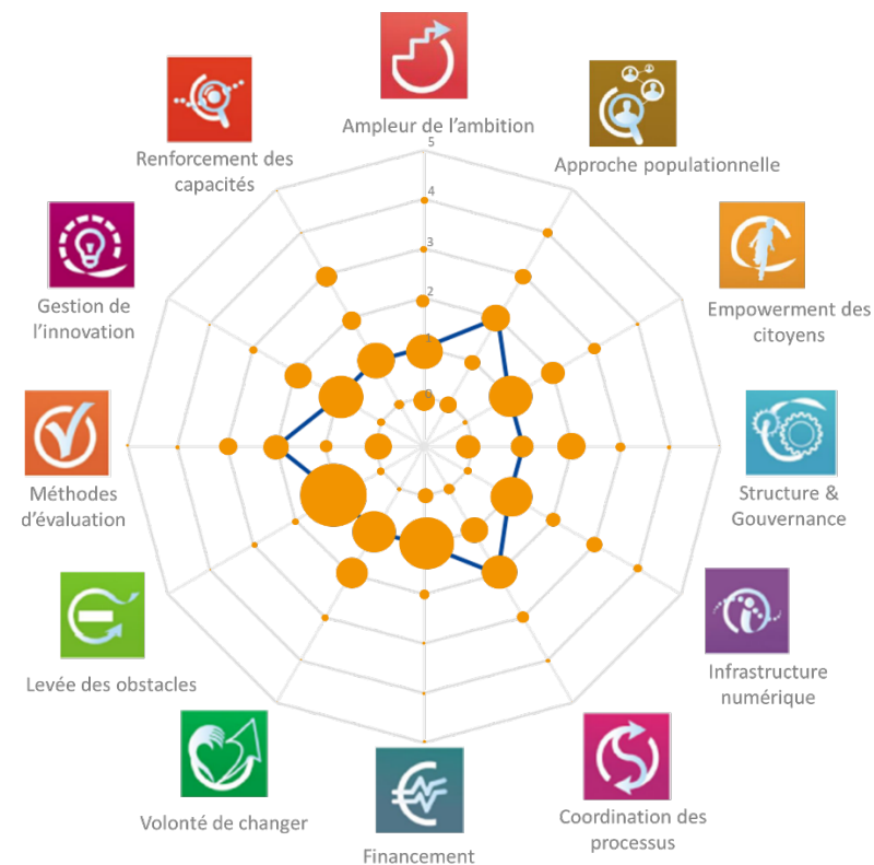
Figure 3 – Évaluation de la maturité de soins intégrés en Belgique selon les 12 dimensions de l'outil SCIROCCO

La ligne bleue représente le score médian pour chaque dimension placée sur une échelle allant de 0 à 5, où un score élevé traduit une grande maturité ou un niveau élevé de préparation au changement. La taille des points orange est proportionnelle au nombre de réponses.