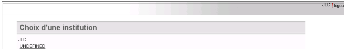
Ecran 10: Choix d'une institution

Dans l'application "Formulaire" l'utilisateur peut introduire les nombres de lits et d'appareils disponibles. Il lui est demandé au préalable pour quelle institution il souhaite le faire (écran 10)