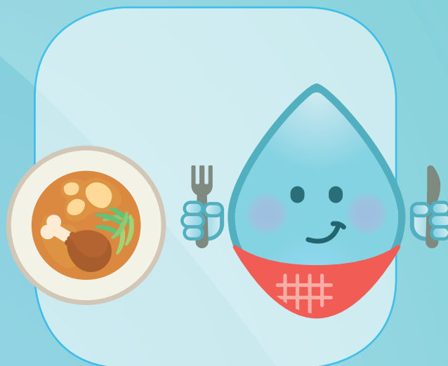
AVANT ET APRÈS AVOIR MANGÉ