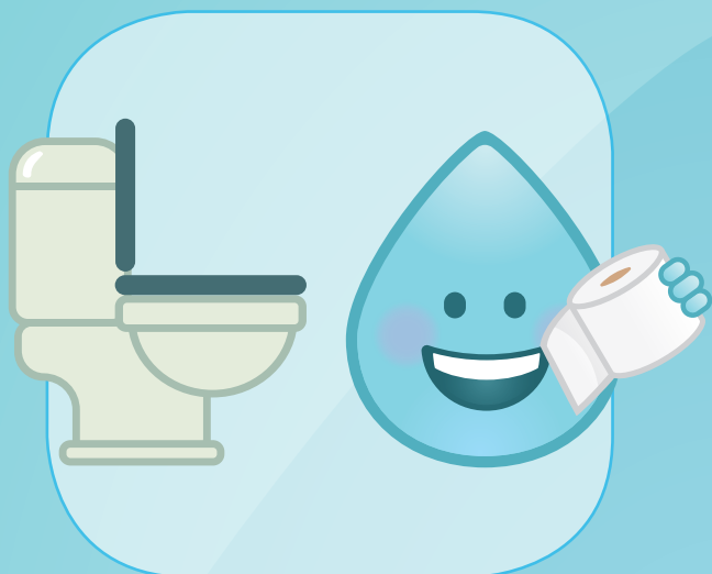
APRÈS ÊTRE ALLÉ AUX TOILETTES