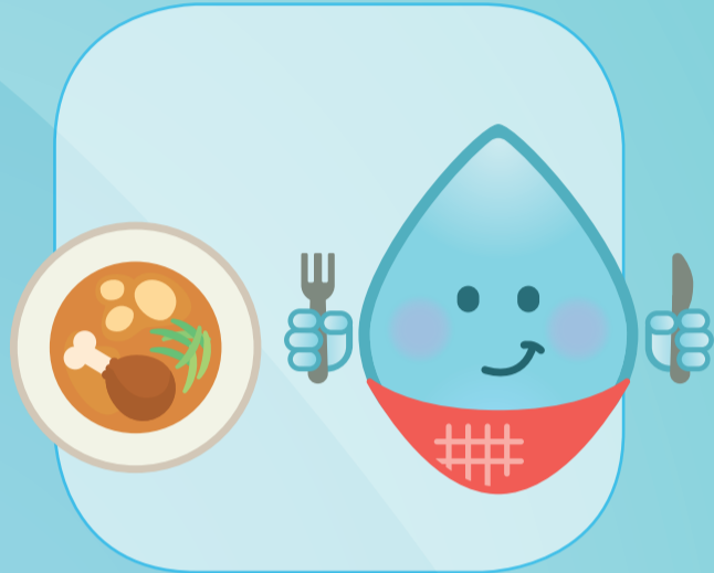
VOOR EN NA EEN MAALTIJD