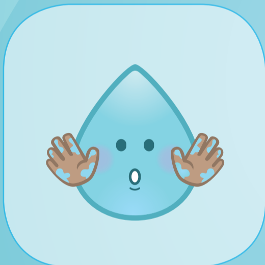
BIJ BEVULDE HANDEN