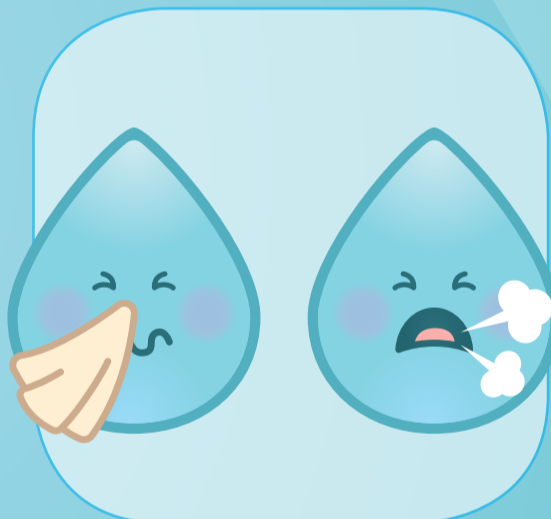
NA HET SNUITEN VAN DE NEUS, HOESTEN OF NIEZEN